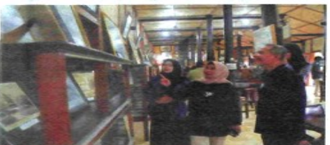
PENGUNJUNG ketika melihat koleksi PDIKM Padangpanjang.