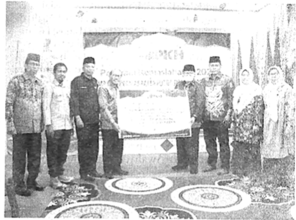
Peresmian Pondok Pesantren Kauman Muhammadiyah, Kota Padang Panjang.

"Alhamdulillah, kita bersyukur dengan diresmikannya asrama santri Pondok Pesantren Kauman Muhamma-