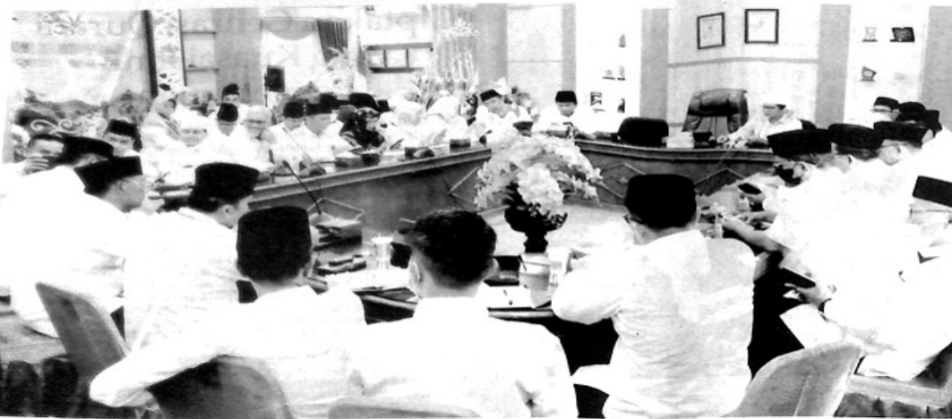
JELANG KEBERANGKATAN—Tergabung dalam kelompok terbang (kloter) 8, Jamaah Calon Haji (JCH) Kota Padangpanjang dapat arahan jelang berangkat pada 2 Juli.

"Kita berharap ke depannya tidak terjadi lagi pembatasan kegiatan masyarakat akibat pandemi Covid-19 ini. Dan juga semoga tidak ada lagi kasus Covid-19 di Kota Padang Panjang ini," tuturnya. (rmd)