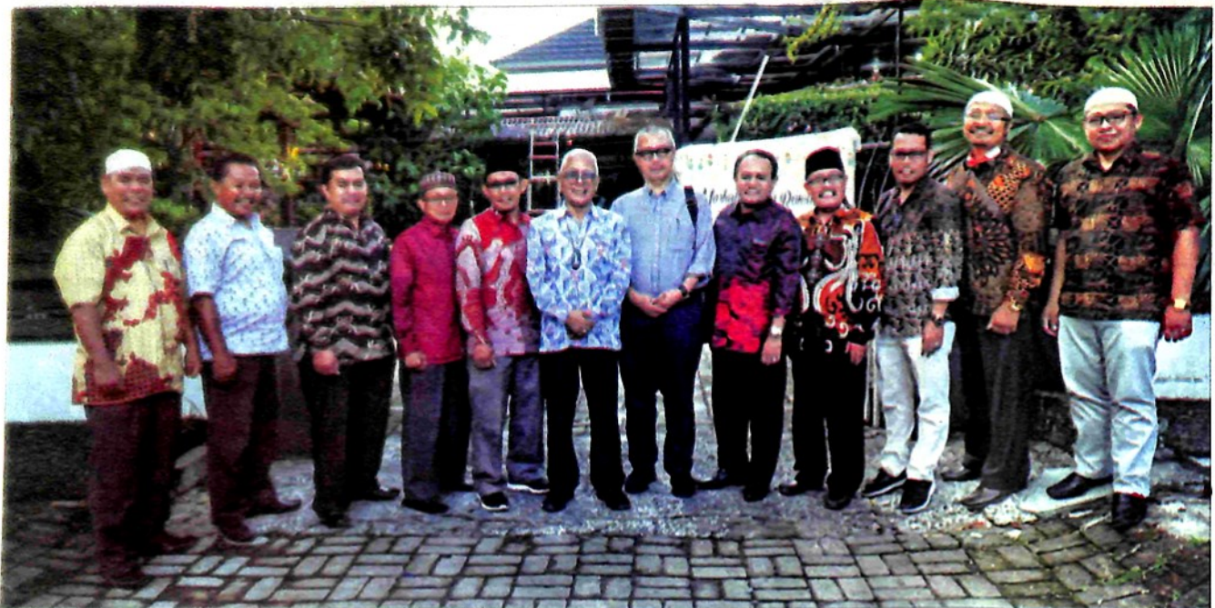
KOMPAK: Pembina, pengurus dan pengawas Yayasan Thawalib foto bersama.