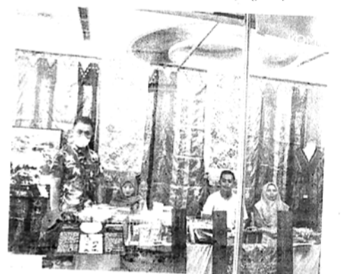
MINAT - Stand pameran Kota Padang Panjang pada Munas Gebu Minang diminati banyak pengunjung.

Javie berharap, dengan banyak diminatinya produk UMKM ini, bisa membuat produk-produk asli UMKM Padang Panjang dikenal banyak orang, baik di dalam daerah maupun di luar daerah dan menjadi ikon Kota Padang Panjang. (205)