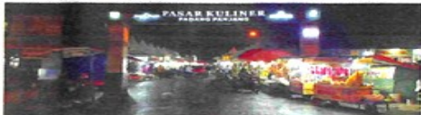
KAWASAN Pasar Kuliner Padangpanjang sebagai tempat wisata lambung bagi wisatawan.

pada lintasan regional antara Kota Padang dengan Kota Bukittinggi, juga dengan Kabupaten Tanah Datar, Kabupaten Solok dan Kota Solok.