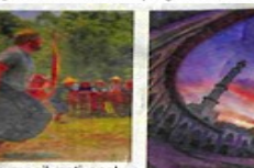
KEINDAHAN Islamic Center Padangpanjang.