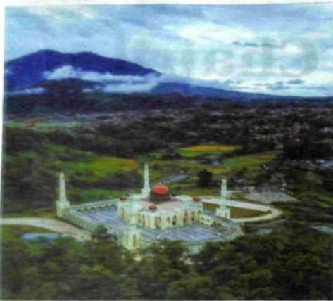
ISLAMIC Center Padangpanjang dengan latar belakang Gunung Marapi.