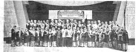
FOTO BERSAMA— Wawako Padangpanjang Asrul foto bersama saat mengajak OBK Padangpanjang ikut ambil peran mengembalikan budaya kembali ke Surau.

ngajak seluruh Bundo Kandang saling bergandengan dengan organisasi lainnya, membina dan mengarahkan generasi muda kembali ke surau serta mencintai adat dan budaya Minangkabau.