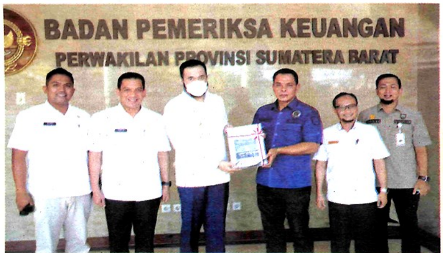
Rombongan Pemko Padang Panjang di BPK RI Perwakilan Sumatera Barat.

strategis untuk penyusunan laporan keuangan ini. Di antaranya menindaklanjuti temuan-temuan BPK tahun sebelumnya. "Jadi temuan-temuan BPK itu kita tindaklanjuti. Kita clear-kan sehingga tidak ada lagi temuan berulang. Kemudian, kita upayakan mempercepat penyelesaian permasalahan aset daerah. Ini yang menjadi temuan BPK dalam setiap tahunnya,"