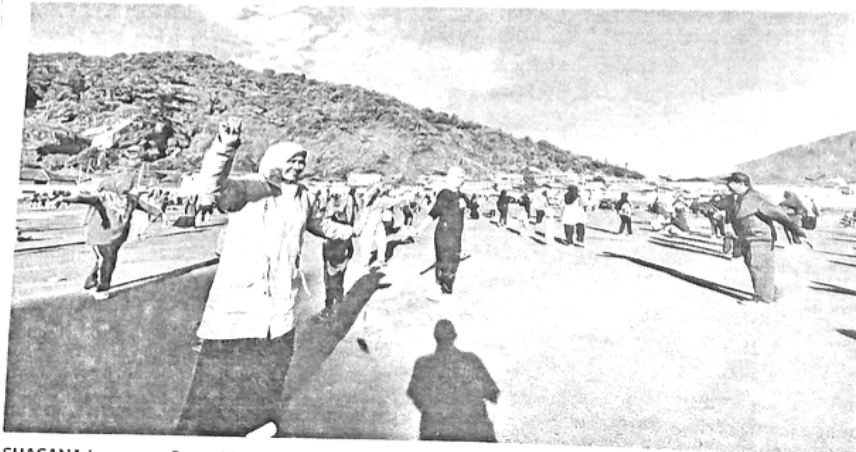
SUASANA Lapangan Bancahlaweh, Minggu (29/5) yang diramaikan para pengunjung untuk berolahraga.

Tidak hanya warga kota yang datang untuk berolahraga, namun juga banyak masyarakat dari Batipuah, X Koto dan sekitarnya. (sup)