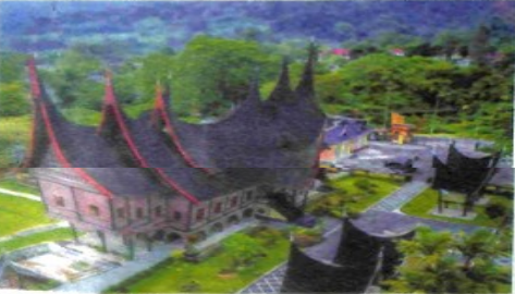
KEINDAHAN PDIKM Padangpanjang yang berada di Kelurahan Silang Bawah Kecamatan Padangpanjang Barat.