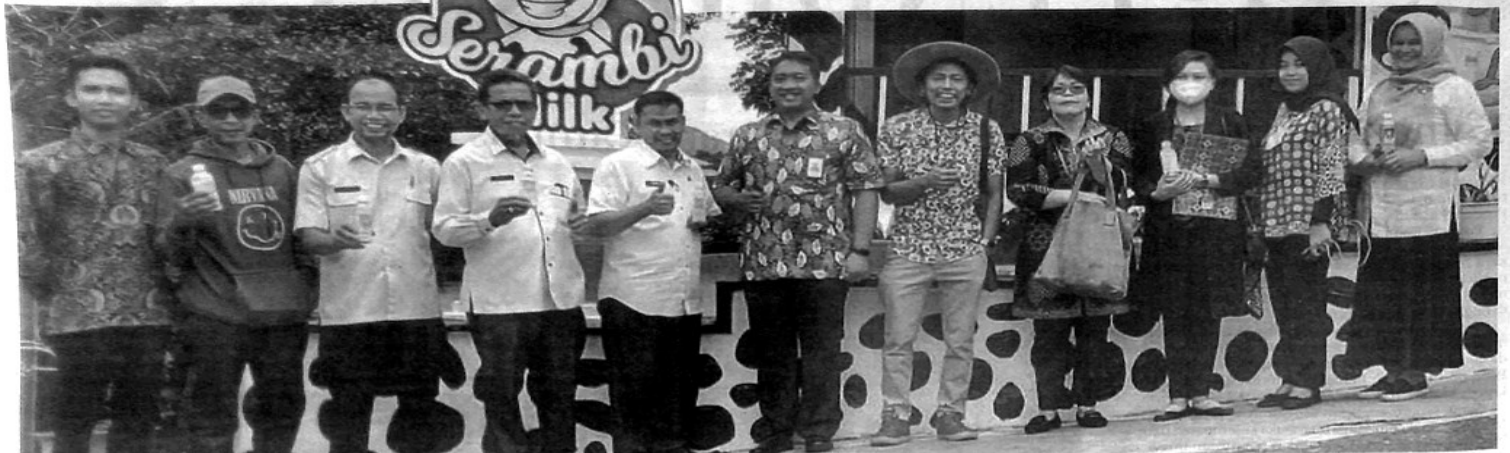
PERWAKILAN dari Kementerian Koordinator Perekonomian ketika mengunjungi Usaha Susu Serambi Milk.