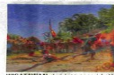
WISATAWAN dari luar negeri ketika menikmati aneka permainan rakyat di Desa Wisata Kubu Gadang.

Karena berada di jantung Sumatera, Padangpanjang terhubung dengan jalur lintas Sumatera, menjadikan kota ini berada pada posisi yang cukup strategis karena terletak