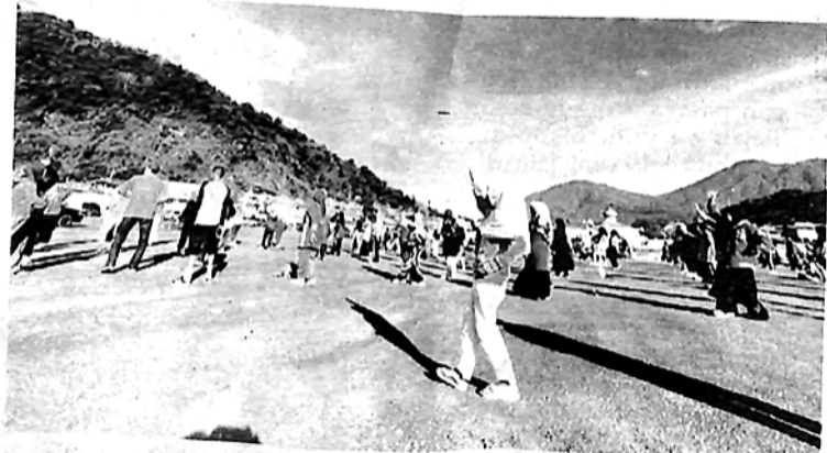
TINGGGI—Animo warga kota Padangpanjang sangat tinggi untuk datang berolahraga ke Lapangan Bancahlaweh setelah dua tahun lebih absen dilanda pandemi Covid-19, Minggu (29/5).

"Dimulainya senam pagi bersama ini, juga akan membangkitkan ekonomi masyarakat yang berjualan. Bagaimana tidak, sehabis berolahraga masyarakat akan langsung menyantap makanan dengan banyaknya pedagang kuliner yang berjualan di sini. Mulai dari ketupat, sate, susu, buah-buahan, bakso bakar dan makanan lainnya," tuturnya. Tidak hanya warga kota yang datang untuk berolahraga, namun juga banyak masyarakat dari Batipuah, X Koto dan sekitarnya. (rmd)