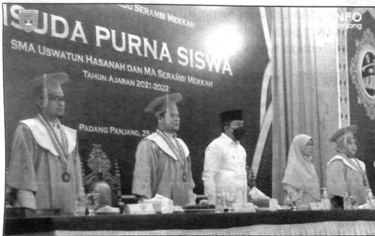
SEBANYAK 34 santri SMA Uswatun Hasanah dan Madrasah Aliyah (MA) Serambi Mekkah (Pondok Pesantren Terpadu Serambi Mekkah) ikuti Wisuda Angkatan ke-23 tahun ajaran