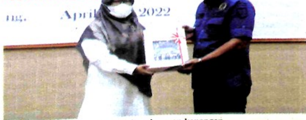
Penyerahan laporan keuangan.

"Kita sudah mendapatkan opini WTP untuk penyusunan laporan keuangan tahun 2020. Dan saat ini kita kembali menerima piagam penghargaan WTP. Pencapaian WTP dari Kementerian Keuangan. Ini merupakan yang keenam kalinya kita mendapatkan opini WTP berturut-turut," terangnya. Namun demikian, katanya, untuk ke depan perlu menetapkan rencana-rencana