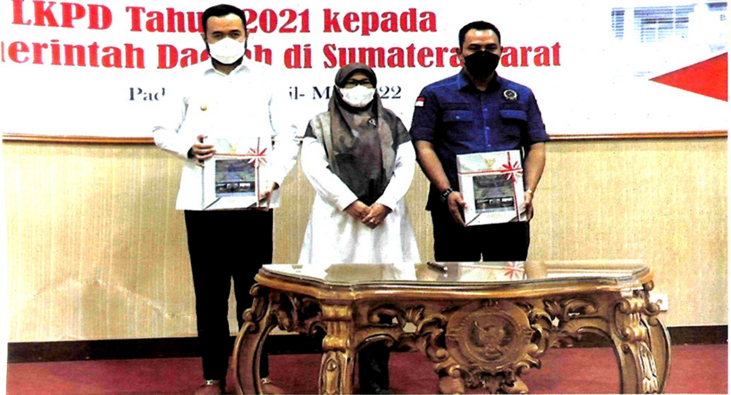
Walikota Padang Panjang Fadly Amran (Kiri) usai terima penghargaan WTP dari BPK RI.