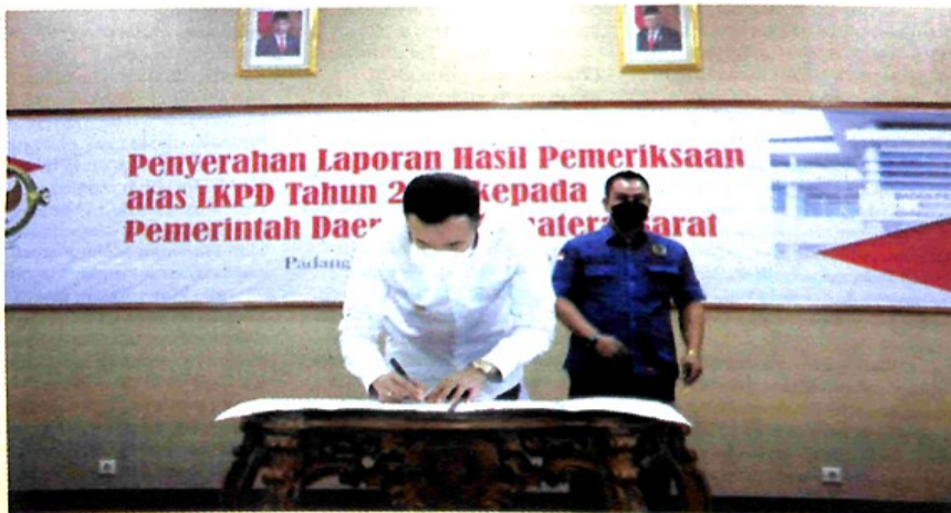
Penandatanganan berita acara penyerahan laporan hasil pemeriksaan LKPD.

Keberhasilan Pemko Padang Panjang meraih prestasi WTP dari BPK dalam pengelolaan keuangan negara pada situasi pandemi