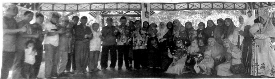
PAGUYUBAN Solok Saiyo Sakato ketika menggelar kegiatan silaturahmi di PDIKM Padangpanjang.

S3 sebut Nuryanuar, siap mendukung program Pemko. "Kegiatan S3 lebih banyak menjalin silaturahmi dan kepedulian sosial. Kami juga selalu siap mendukung program Pemerintah Kota Padangpanjang," katanya. (ned)