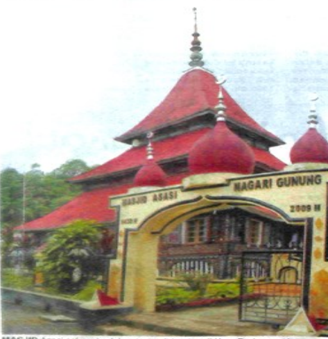
MASJID Asasi sebagai salah satu masjid tertua di Kota Padangpanjang.

Menikmati Keindahan Alam dan Aneka Kuliner Khas Mesir van Andalus