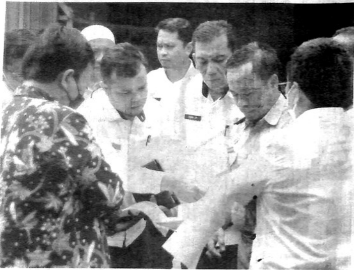
CEK FISIK— KPK dan Pemko melakukan cek fisik aset Pasar Sayur Bukit Bukit Surungan Padangpanjang.