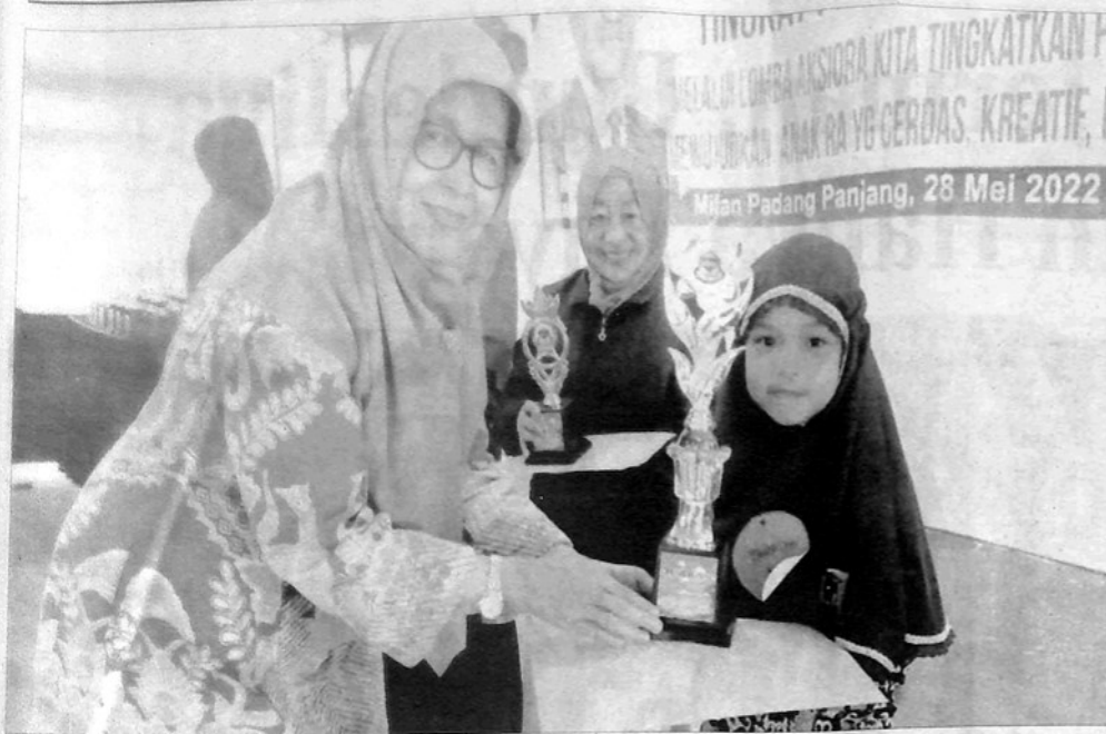
ASSAADATUL KAMILAH dari RA Alquran Thawalib Padangpanjang meraih Juara I Tahfiz Putri Kompetisi Seni, Olahraga dan Agama RA Tingkat Sumbar.